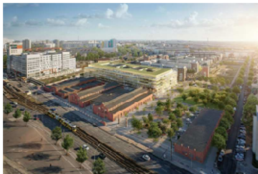
Projekt Landsberger Allee / Weitere Informationen unter https://hbreavis.com/de/

In der Zukunft möchten wir weiter in Deutschland investieren. Derzeit werden aktiv Grundstücke mit entsprechenden Planungs- und Bebauungsmöglichkeiten gesucht und die Entwicklungsmöglichkeiten geprüft.